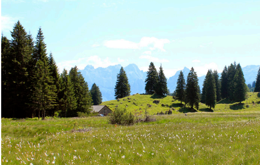
Hochmoor im Schwändital

Eines der zahlreichen nationalen CO 2 -Kompensationsprojekte unterstützt die Renaturierung von Hochmooren. Durch diese Wiedervernässung gelangt nicht nur weniger Treibgas in die Atmosphäre. Zusätzlich werden auch Biodiversität und der natürliche Wasserhaushalt gefördert. Als weiteres CO 2 -Kompensationsprojekt fördern wir die klimaoptimierte Bewirtschaftung von Schweizer Wäldern, damit CO 2 gespeichert werden kann. Entsprechend werden CO 2 -Kompensationsprojekte kontinuierlich gefördert und ausgebaut.