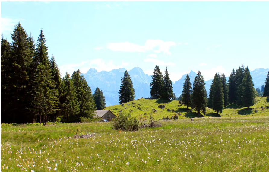
Hochmoor im Schwändital

Eines der zahlreichen nationalen Klimaschutzprojekte von myclimate unterstützt die Renaturierung von Hochmooren. Durch diese Wiedervernässung gelangt nicht nur weniger Treibgas in die Atmosphäre. Zusätzlich werden auch Biodiversität und der natürliche Wasserhaushalt gefördert. Als weiteres Klimaschutzprojekt von myclimate fördern wir die klimaoptimierte Bewirtschaftung von Schweizer Wäldern, damit CO 2 gespeichert werden kann. Entsprechend werden Klimaschutzprojekte kontinuierlich gefördert und ausgebaut.