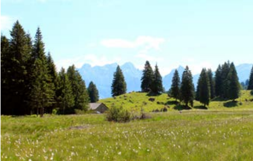
Hochmoor im Schwändital

Eines der zahlreichen nationalen Klimaschutzprojekte von myclimate unterstützt die Renaturierung von Hochmooren. Durch diese Wiedervernässung gelangt nicht nur weniger Treibgas in die Atmosphäre. Zusätzlich werden auch Biodiversität und der natürliche Wasserhaushalt gefördert. Als weiteres Klimaschutzprojekt von myclimate fördern wir die klimaoptimierte Bewirtschaftung von Schweizer Wäldern, damit CO 2 gespeichert werden kann. Entsprechend werden Klimaschutzprojekte kontinuierlich gefördert und ausgebaut.